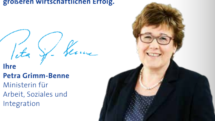
Ihre Petra Grimm-Benne Ministerin für Arbeit, Soziales und Integration

Nutzen Sie Ihre Chance auf hohe Mitarbeiterbindung, qualifizierte Entwicklung, optimierte Prozesse und größeren wirtschaftlichen Erfolg.